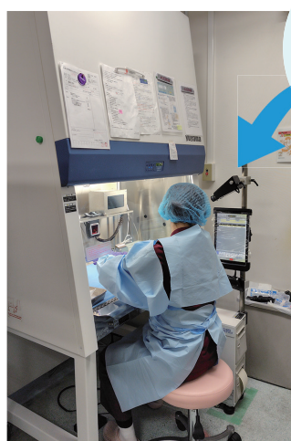
遠隔鑑査用 カメラ

内蔵の高機能カメラがお薬の色、形、大きさといった要素を分析し鑑査を支援してくれます。