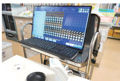
鑑査支援機構付き 全自動錠剤分包機

内蔵の高機能カメラがお薬の色、形、大きさといった要素を分析し鑑査を支援してくれます。